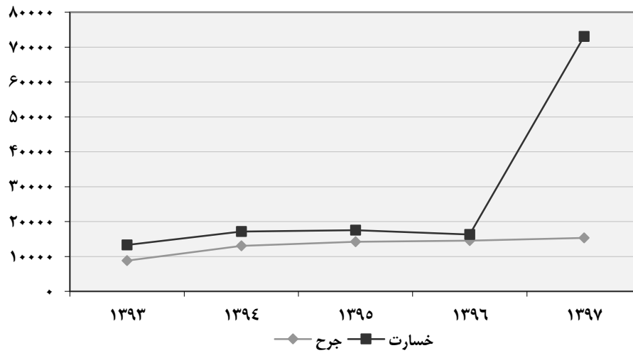
۱۵-۳- تصادفات برون شهری وسایل نقلیه منجر به جرح و خسارت